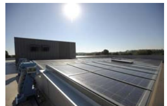
Panneaux photovoltaïques au collège Lucie et Raymond Aubrac