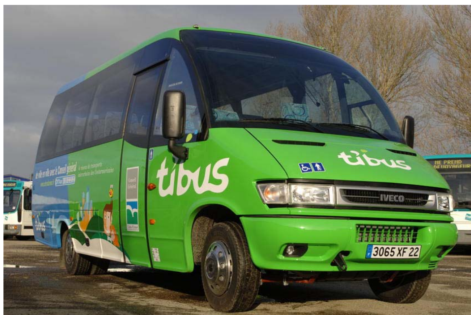
Un Tibus spécialisé pour le transport des personnes en situation de handicap

► Tarifs, recherche d'itinéraires, téléchargement de formulaire d'inscription : www.cotesdarmor.fr / Transports scolaires