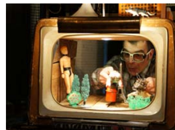
La Compagnie Scopitone, accueillie l'an passé au collège public de Lamballe.