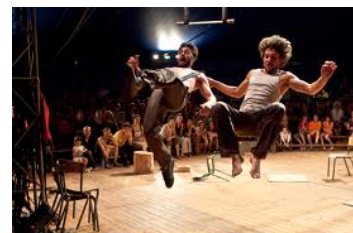
La Compagnie Galapiat, accueillie l'an passé au collège public de Bégard DR

■ La compagnie théâtrales Vertigo, accueillie au collège Gustave Téry de Lamballe , pour une résidence de création théâtrale de l'œuvre de Molière "Dom Juan" (en partenariat avec le centre culturel "Quai des Rêves" de Lamballe). Sont concernés 1 classe de 3 ème + 2 classes de SEGPA + 15 élèves volontaires pour l'atelier.