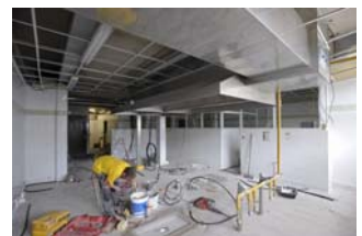
Les travaux du collège Marie-José Chombart-de-Lauwe de Paimpol, achevés en 2011