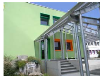
Collège de Callac