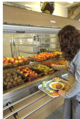
Objectif fixé par le Conseil général : aux collèges : viser les 15 à 20% de leurs achats en produits locaux/bio/équitable

7 collèges publics ont souhaité s'engager avec le Conseil général dans ce projet, afin de développer leurs pratiques d'achats en local : les collèges de Bégard, Pléneuf Val André, Plouasne, Pontrieux, Rostrenen, Saint Briec (Racine et Jean Macé). Parallèlement à cette démarche qui mobilise au premier plan les personnels de cuisine, des actions autour du compostage , du gaspillage alimentaire et des échanges internationaux avec des établissements scolaires anglais sont d'ores et déjà lancés auprès de ces 7 collèges.