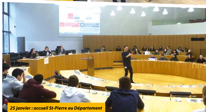
25 janvier : accueil St-Pierre au Département