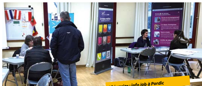
18 janvier : info job à Pordic