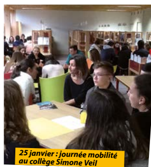
25 janvier : journée mobilité au collège Simone Veil