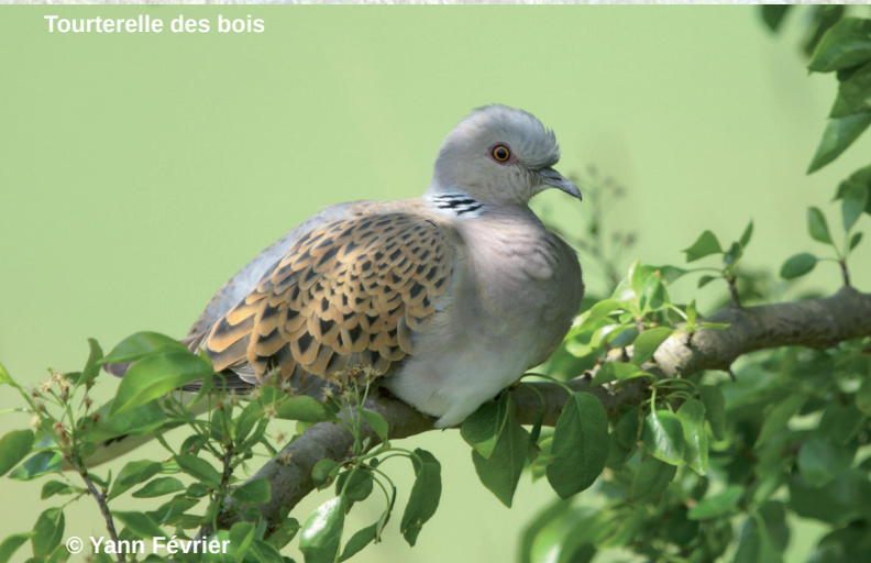
Tourterelle des bois