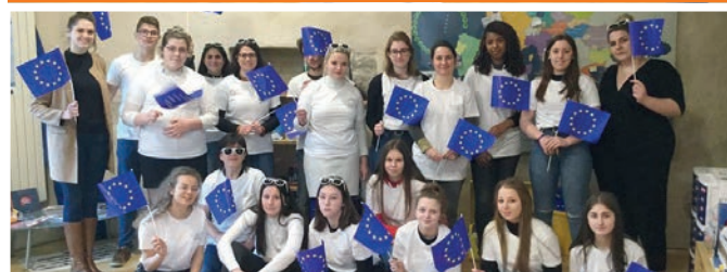
10/03 > 14 élèves de 1 er bac pro aide à la personne de la Maison Familiale Rurale de Loudéac