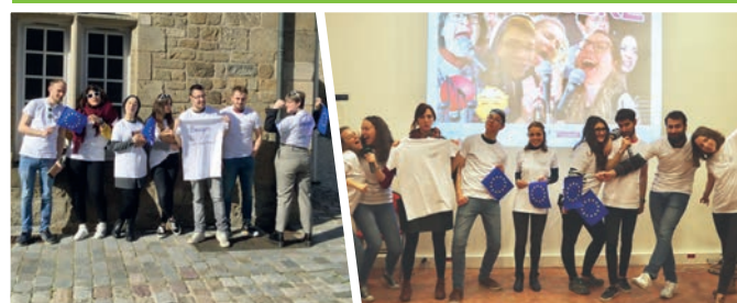
12/03 > séminaire de préparation à un départ en mobilité « Premier Pas » en Espagne pour 6 jeunes costarmoricains