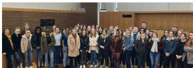
9/03 > une cinquantaine d'étudiants en BTS Services et Prestations des Secteurs Sanitaire et Social (SP3S) du Lycée Notre Dame de Campostal