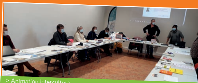
> Animation Intercultura Déblocage linguistique pour les membres du consortium MobiSkoL22