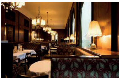
« Le Starbucks » à Vienne

Pia nous informe qu'en Autriche, à 15 heures, c'est l'heure du Café. Les gens se retrouvent entre amis au « Kaffeehaus » pour échanger devant un café et une pâtisserie. À Vienne, il y a beaucoup de petits cafés, car les Autrichiens préfèrent le déguster assis plutôt qu'à emporter. Un Autrichien boit environ 3 tasses de café par jour et en consomme environ 7,8 kg par an.