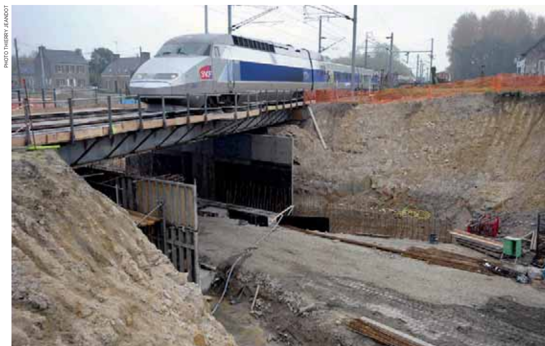
▲ Le projet Bretagne à grande vitesse comprend la réalisation de la LGV, mais aussi l'amélioration de la liaison entre Rennes et Brest, notamment à travers la suppression de passages à niveaux, comme ici à Plounérin en 2009.