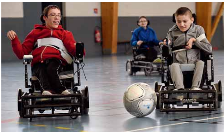
▲ Les membres de l'équipe de foot-fauteuil à l'entraînement du samedi matin à Evran.