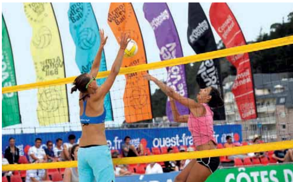
▲ Les Estivales de volley, un événement sportif majeur qui attire 50 000 spectateurs sur chaque édition.

6 500 matchs au total, une centaine de terrains installés chaque jour sur trois plages, près de 200 bénévoles mobilisés... Les chiffres des Estivales de volley donnent le tournis. Portée depuis 27 ans par la même équipe de copains, cette manifestation sportive gratuite allie avec succès sport et spectacle.