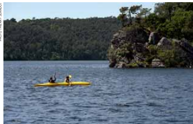
▲ Parmi les activités accessibles au grand public, la remontée du lac en canoë-kayak.

canoë, des séjours pêche avec la Fédération départementale de pêche, et des séjours pour les personnes en situation de handicap. Elle a par ailleurs ouvert une boutique, où l'on peut boire un café ou déguster une glace en profitant d'une vue imprenable sur le lac. ◀