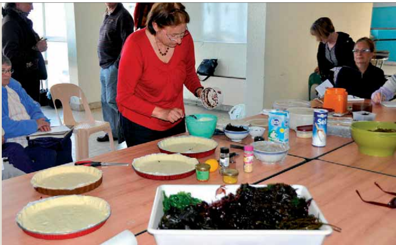
Mat eo ar bezhin met lod a zo gwelloc'h evit ar re all.