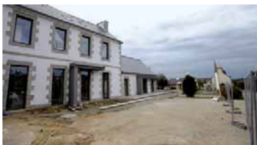
Le multi-services en cours de finition à Pont-Melvez.