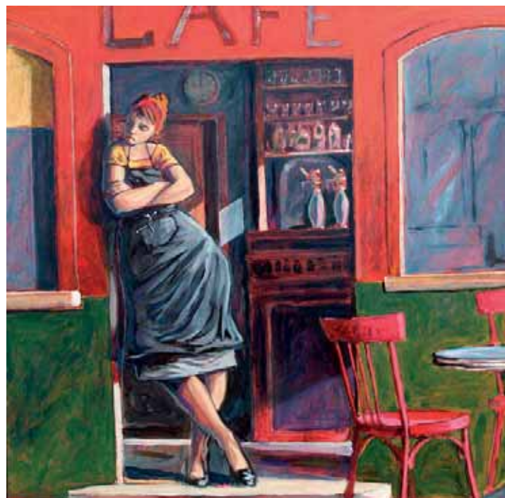
Tableau de Jacques Kerdrel Hors Saison .

Pas moins de 168 artistes des cinq départements bretons présenteront 800 œuvres du 19 janvier au 3 février dans la salle Robien à Saint-Brieuc. Parmi les 126 peintres, 41 sculpteurs et un auteur de BD, 80 nouveaux.