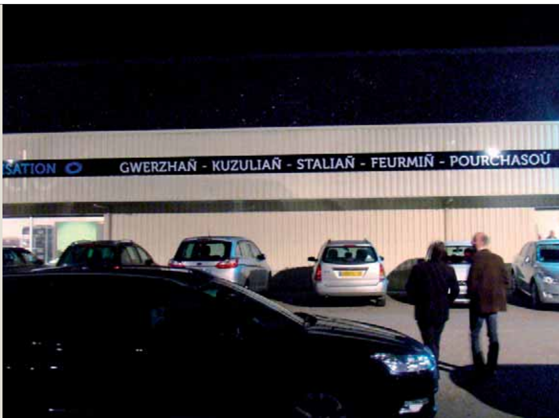
Divyezhek eo panelloù stal nevez Koroll en Mur.