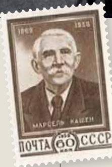
Cachin, un des rares à avoir eu un timbre à son effigie en URSS.