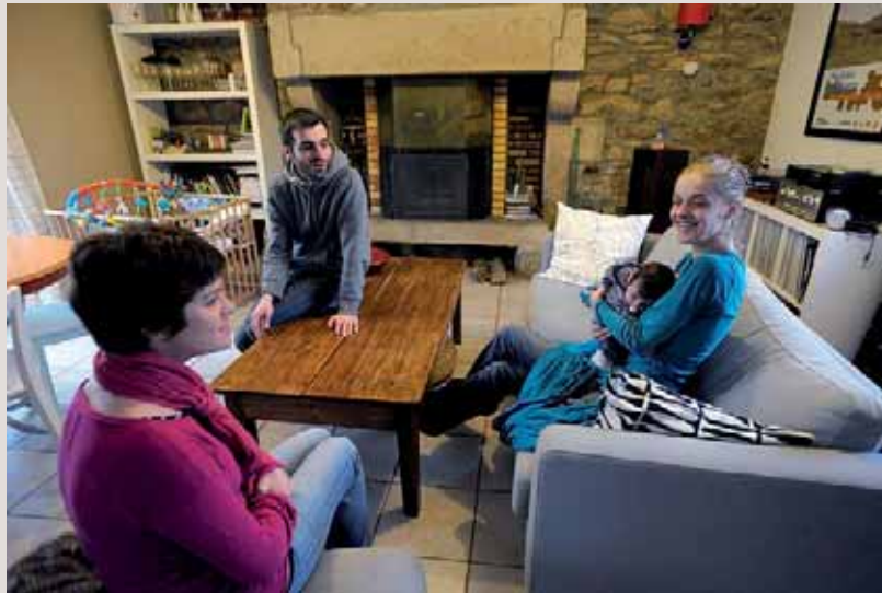
On ne sait pas qui de la mère, du père ou du bébé a le plus bénéficié de l'accompagnement de la sage-femme. Les trois sûrement. C'est probablement cela, un accompagnement réussi.

Étant donné l'impossibilité de se déplacer de la patiente, les visites ne se sont pas limitées aux examens cliniques. La