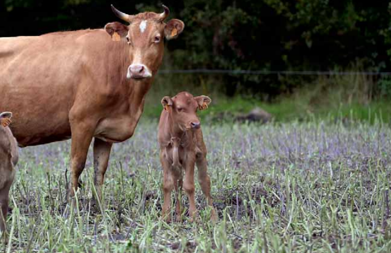
Une vache Froment du Léon avec son petit et une gémisse, à la couleur plus grise, issue d'un croisement avec la race normande.