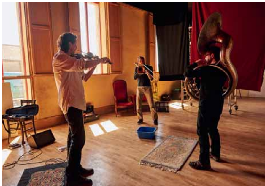
Le groupe Khamsin en répétition dans la chaleur du Logelloù.