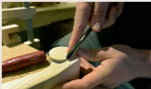
Le rond qui orne la partie supérieure de la lyre armoricaine représente le féminin primordial.

Le couple de luthiers prend part à une aventure on ne peut plus singulière. En effet, après