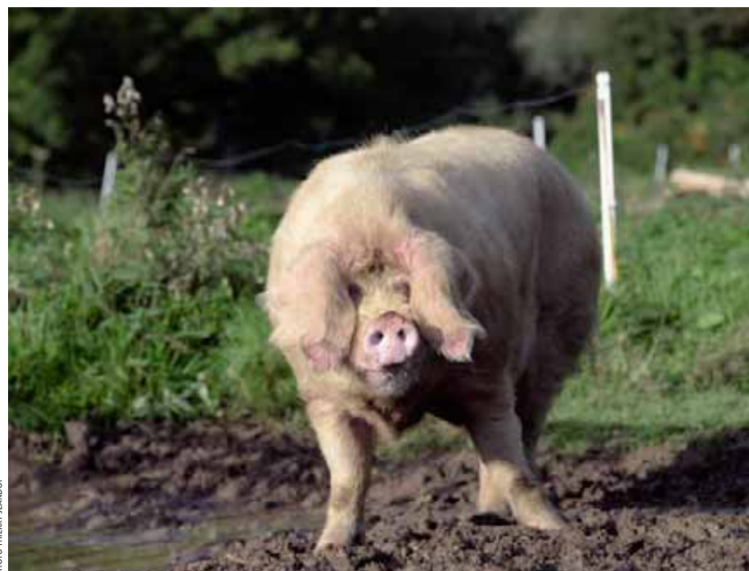
Avec ses longues oreilles qui lui cachent les yeux, le porc blanc de l'Ouest.