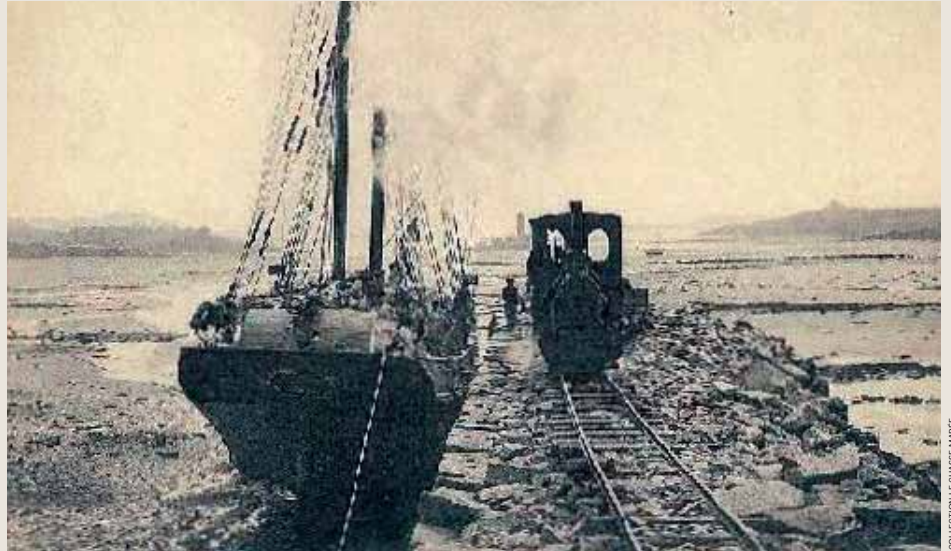
COLLECTION LE CHOISE-AMARÉ