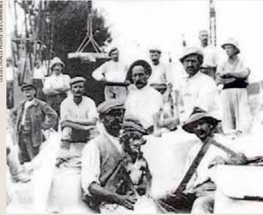
Des ouvriers italiens vers 1910 à la Pyrie au Hinglé.

E voquer l'histoire du granite en Bretagne, et singulièrement en Côtes d'Armor, c'est déjà rappeler que cette roche magmatique (1) est encore exploitée aujourd'hui. Il reste principalement deux bassins d'extraction et de façonnage dans le département : d'une part celui du Trégor avec Ploumanac'h (La Clarté) et Pleumeur-Bodou, d'autre part le massif de Dinan (Languédias, Mégrit, Brusvily, Le Hinglé), auxquels on peut ajouter le pôle de Saint-Carreuc près de Plaintel.