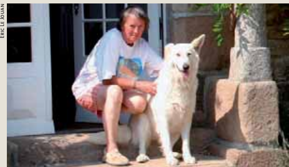
Sur le perron de son manoir de Belle-Fontaine, à Pontrieux.