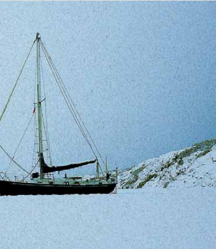
MDV - ÉDITIONS

Avec son fidèle Esquilo, prisonnier de la mer gelée, lors d'une de ses expéditions en Patagonie.