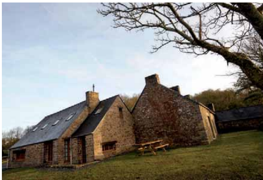
Le gîte d'étape de Plourivo, un investissement de 570 000 € subventionné à 20 % par le Département.