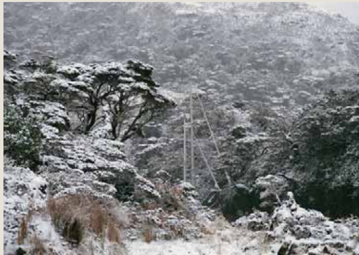
MDV - ÉDITIONS

(*) Le Canadien Joshua Slocum (1844 - 1909), fut le premier à boucler un tour du monde en solitaire à la voile.