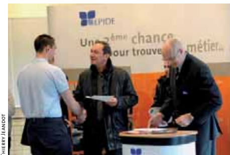
Le directeur (à droite) remet aux jeunes leur Certificat de formation générale (CFG) et le Passeport de compétences informatiques européen (PCIE) lors d'une cérémonie qui réunit volontaires et agents.

Les jeunes sont internes et portent tous la même tenue, identique à celle du personnel encadrant - 38 agents dont 50 % ont eu un parcours militaire