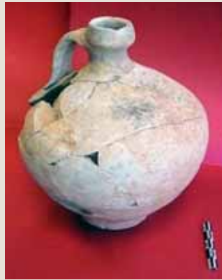
Une poterie du Quiou du II e siècle.