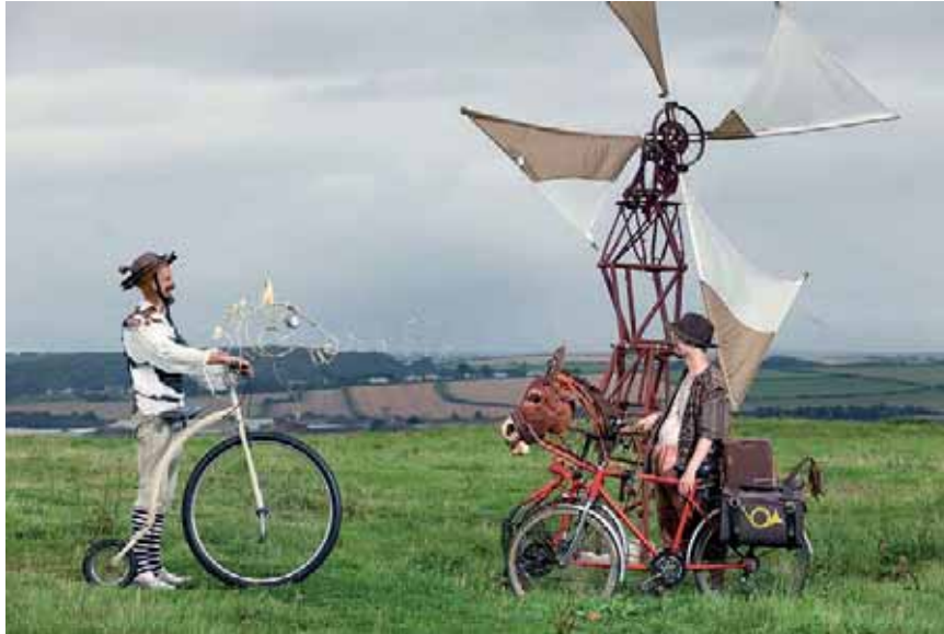
La compagnie Burn the Curtain en action.

La compagnie britannique Burn the Curtain présentera son spectacle d'art de la rue à Saint-Brieuc le 21 juin