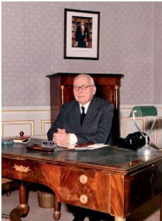
PLÉVEN

En août 1940, bras droit du général de Gaulle et Secrétaire général de l'Afrique équatoriale française, il organise avec Leclerc le ralliement des territoires africains. Après trois ministères, en juillet 1950, il accède à la Présidence du Conseil en pleine Guerre d'Indochine. En septembre 1945, il devient conseiller