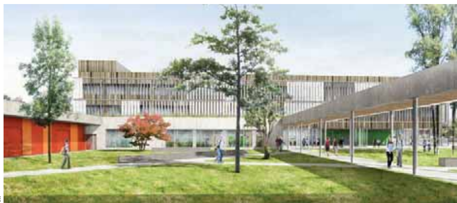
Vue arrière du futur collège avec la cour des élèves.