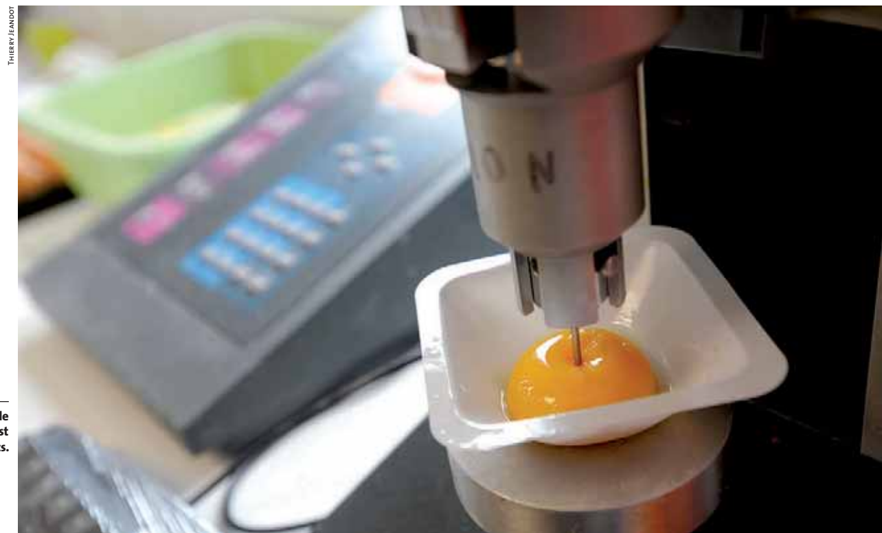
La mesure de la solidité de la membrane vitelline est l'une des spécialités de Zootests.