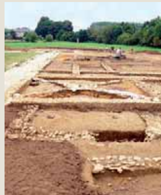
La villa se dévoile.