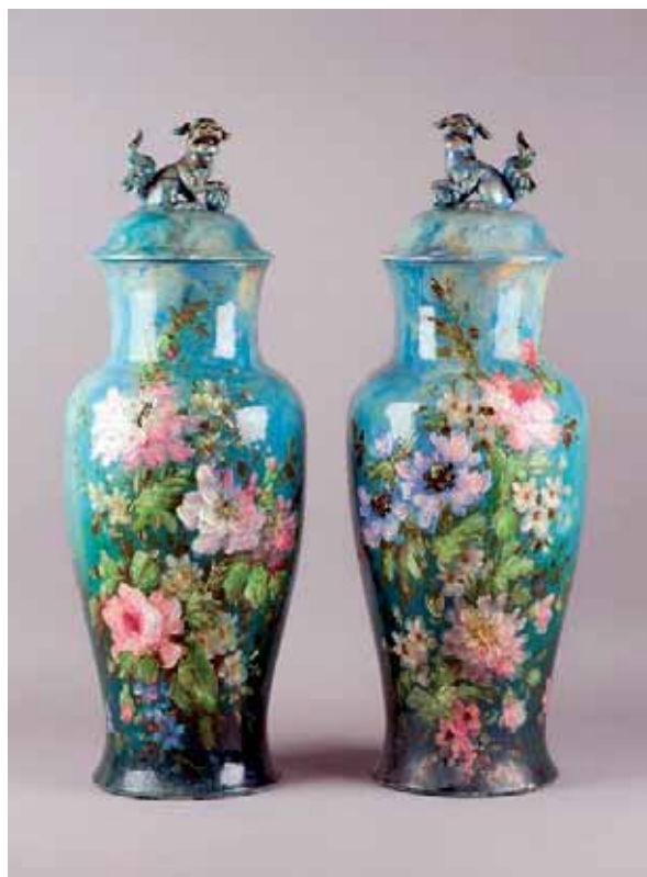
Les barbotines sont des céramiques à décors naturalistes en relief.