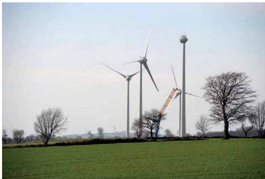
Le parc des landes du Mené sera inauguré début juillet. Le capital de la société exploitante, Citeol, est détenu à 30% par des habitants du territoire réunis en cigales (*).

Unité de méthanisation, biocarburants, éolien, maisons solaires... Dans le Mené, les initiatives s'enchaînent. Coup de projecteur sur un territoire rural qui sait tirer parti de ses ressources énergétiques, dans une démarche de diversification.