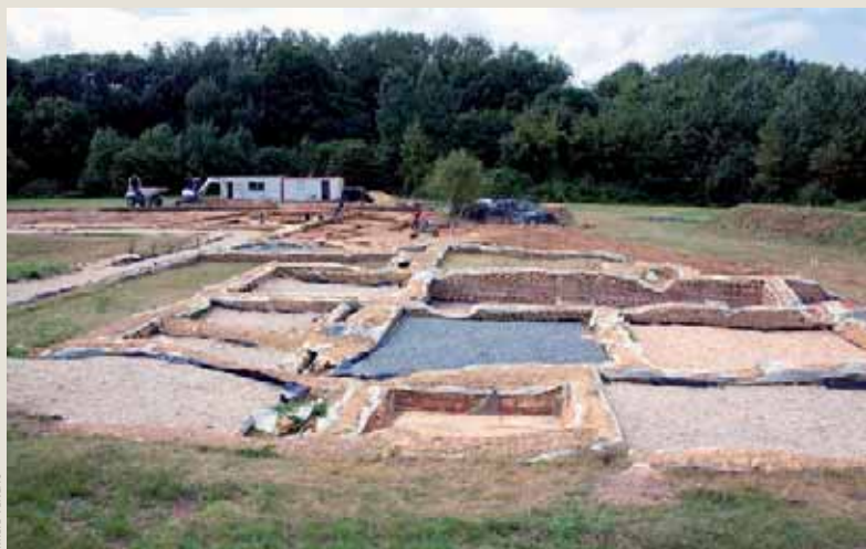
Le chantier des fouilles du Quiou montre les thermes mis au jour.

Quant au château du Guildo, situé dans l'estuaire de l'Arguenon dans la commune de Créhen, il date de l'époque médiévale, à laquelle l'archéologie s'intéresse également. L'été 2013 verra la dernière campagne consacrée à ce site, du 17 juin au 26 juillet. Grâce aux fouilles réalisées depuis 1995, l'architecture de cette propriété devenue départementale en 1981 a pu être reconstituée. Plusieurs restitutions en 3D ont même pu être réalisées par Elen Esnault de l'Inrap. Le public est assez "bluffé" quand il voit l'esquisse de ce que fut l'édifice au temps de sa "splendeur", à la fois massif et élégant, assez vaste puisqu'il s'étendait sur 3000 m 2 . Sa construction a débuté au XIII e siècle. Comme beaucoup d'autres châteaux, il fut détruit à plusieurs reprises, au cours des guerres de succession de Bretagne entre 1314 et 1364. Bien que reconstruit au XIV e siècle et modifié avec quelques éléments de confort, la guerre de cent ans, qui se termina au milieu du XV e siècle, ne fera de lui qu'une bouchée.