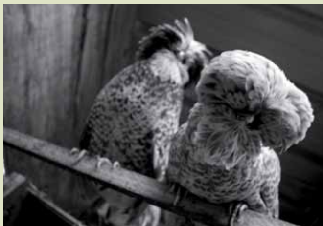
Deux poules naines de la race padoue, facile pour débiter!