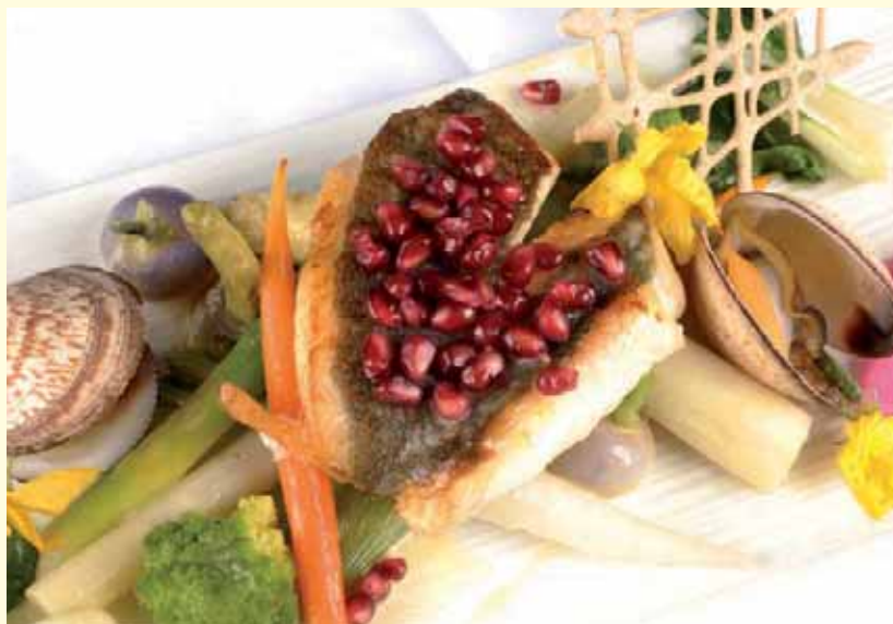
Recette élaborée par le Brezoune, Ploufragan

Mettre à désabler les coquillages puis rincer. Éplucher, rincer les petits légumes et les mettre dans une sauteuse couverte avec un filet d'huile d'olive, du beurre, du sel et du poivre. Ouvrir les coquillages dans une sauteuse avec de l'eau. Cuire le Saint-Pierre sur la peau. Dresser sur un plat