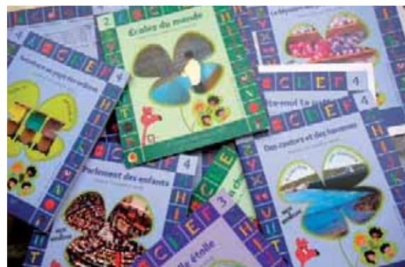
Les livres des éditions Wisdap s'adressent aux enfants de 6 à 10 ans.