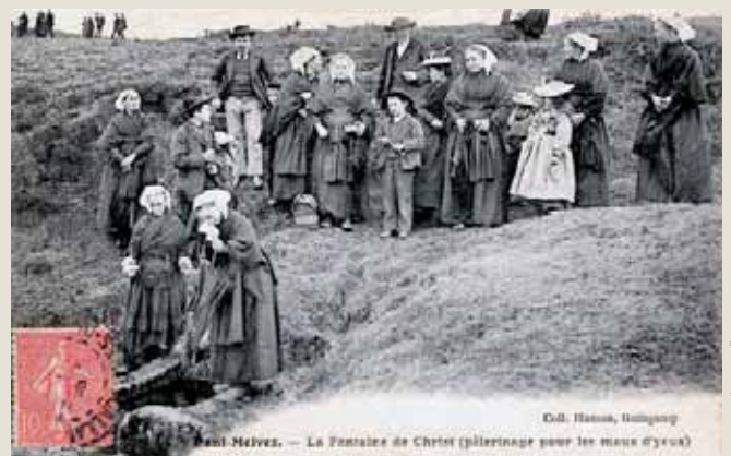
COLLECTION JACQUES DUCHEMIN