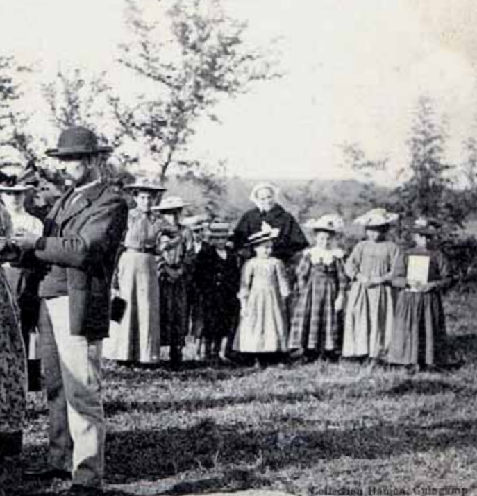
ons de GALLIAC. - BULAT-PESTIVIEN. - La Fontaine de la Vierge le jour du Pardon