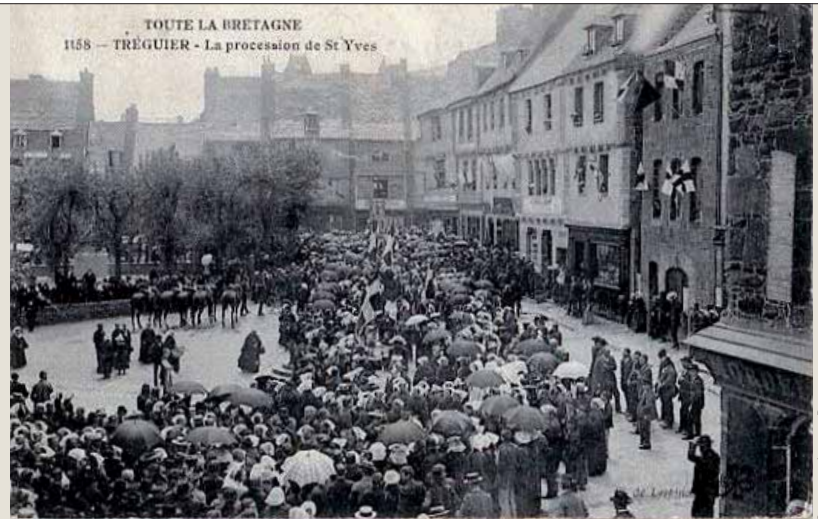
COLLECTION JACQUES DUCHEMIN