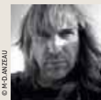
JEAN-CLAUDE LEROY © SPANZAROU

La Ligue de l'Enseignement des Côtes d'Armor poursuit le cycle « Un jeudi, un écrivain » consacré à la question