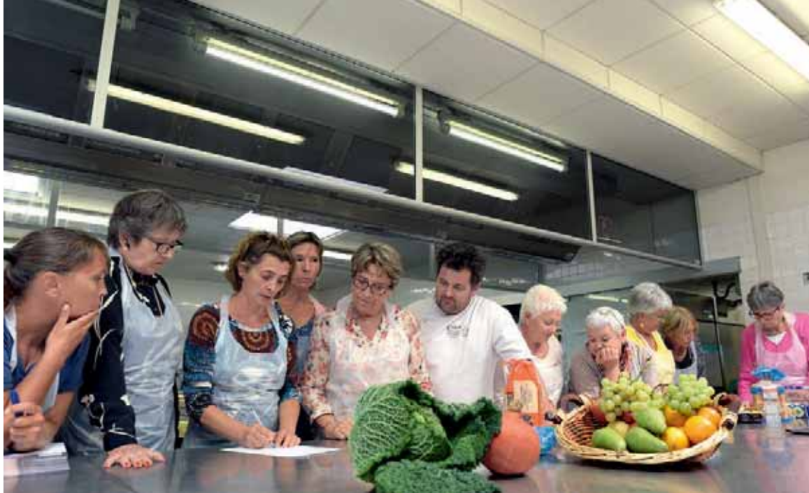
Les participants à la formation « Transmission des savoirs culinaires pour les bénévoles des associations d'aide alimentaire ».