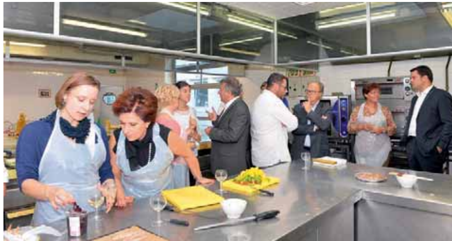
La délégation polonaise et les représentants du Département, de la Cité du goût et de la Chambre de Métiers et de l'Artisanat aux fourneaux.