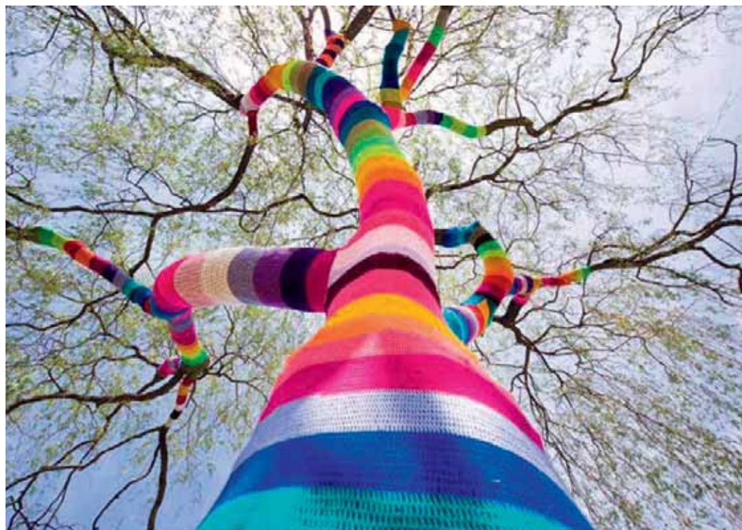
Le tricot urbain, réalisé en partenariat avec trois Ehpad, a été l'un des projets marquants de la précédente édition de Banc public.